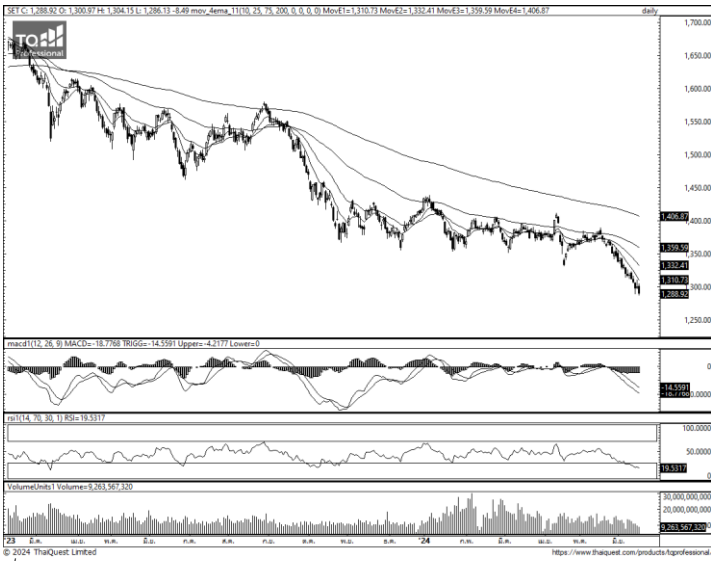
ที่มา ; TQ Professional 60 Mins

SET Index ปิดช่วงเช้า -8.49 จุด ที่ระดับ 1,288.92 จุด มูลค่าการซื้อขาย 3.15 หมื่น ลบ. ขณะที่ MSCI Asia Pacific X.Japan +0.70% ได้แรงหนุนจากกลุ่มเทคโนโลยีในตลาดเอเชียเหนือ หลัง ก.พาณิชย์สหรัฐฯเผยยอดค้าปลีก พ.ค. +0.1% ต่ำกว่าคาด +0.3% MoM ส่งผลให้ CME Fed Watch ที่โอกาส 62% และ 45.0% ที่เฟดจะลดดอกเบี้ยใน ก.ย. , ธ.ค. ซึ่งเป็นผลบวกต่อกลุ่มผู้ผลิตชิป AI และบริษัทซัพพลายเออร์ของ Apple ส่วนตลาดหุ้นเซียงไฮ้เข้านี้ -0.30% หลังตัวเลขเศรษฐกิจจีน เช่น ราคาอสังหาฯ , การผลิตภาคอุตสาหกรรม ยังฟื้นตัวได้ช้า โดยวันพุธนี้นักลงทุนยังรอ ธ.กลางจีนจะแถลงมติอัตราดอกเบี้ย LPR 1 ปี, 5 ปี ว่าจะคงที่ระดับ 3.45% และ 3.95% หรือไม่ ปัจจัยต่างประเทศค่าน้ำมันตลาดหุ้นสหรัฐปิดทำการในวัน Juneteenth และ CPI อังกฤษ พ.ค. คาด 2.0 % & เม.ย. 2.3% YoY สำหรับดัชนี SET เข้านี้ปรับลดลงจากแรงขายกลุ่ม รม., ค่าปลีก, ธนาคาร และโรงไฟฟ้า กอปรกับมีแรงขายในหุ้นขนาด - เล็กที่ปรับลดลง ซึ่งส่วนเกิดจากการบังคับขายในบัญชีมาร์จิน โดยดัชนี SET ยังขาดปัจจัยบวกใหม่เข้ามาหนุน ขณะที่ปัจจัยการเมืองยังต้อง รอศาล รธน. นัดฟังคำสั่งกรณียุบพรรคก้าวไกล , คุณสมบัติินายกฯ ในวันที่ 10 ก.ค. กอปรกับ Fund Flow นักลงทุนต่างชาติยังคงเลือกเข้าลงทุนในตลาดสหรัฐ & ยุโรปที่ได้แรงหนุนจากธุรกิจ AI ปัจจัยในประเทศต้องติดตามการพิจารณาร่างงบประมาณปี 68 รวมถึงบดเคี้ยว พลวัตภาคอสังหาฯ แนวรับดัชนีที่ 1,280 - 1,285 แนวต้าน 1,295 - 1,300