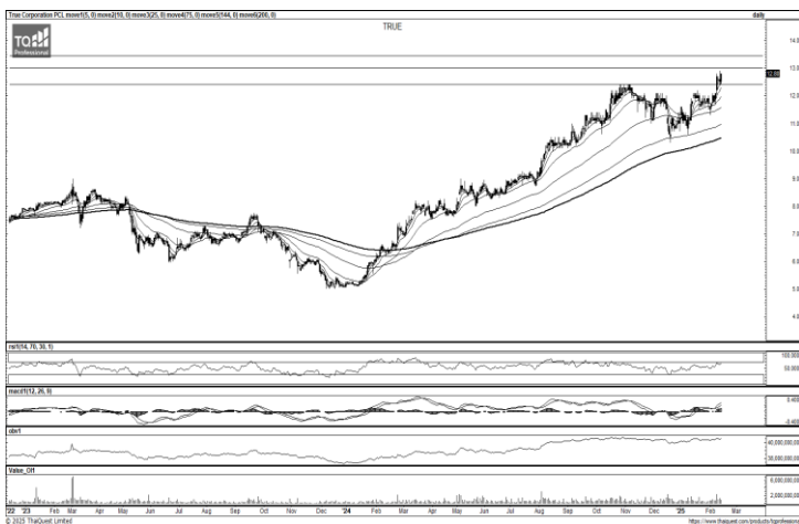
ที่มา ; TQ Professional

แนะนำเก็งกำไร แท่งเทียนเริ่มมีสัญญาณฟื้นตัวจากโซนต่ำ ด้านปริมาณการซื้อขายเข้าสะสม ส่วน RSI / MACD มีสัญญาณเร่งตัวบวก เบื้องต้นหากยืนแนวรับ 10.40 บาท ได้ลุ้นเห็นการขยับขึ้นไปทดสอบแนวต้านถัดไป 12.50-13.60 บาท ส่วนจุด Stop Loss 10.00 บาท